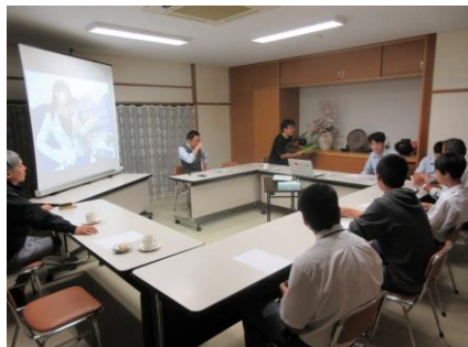
2019年 退所前セミナー

施設を出る前の子どもたちにセミナー・絵画コンクール・卒園を祝う会・大学等への進学進級助成などを行っています。