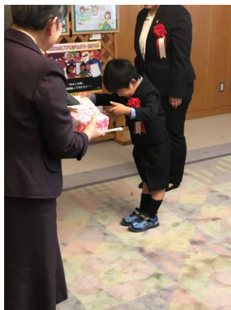
2019年絵画コンクール表彰式