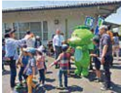
こどもの日 バーベキュー大会